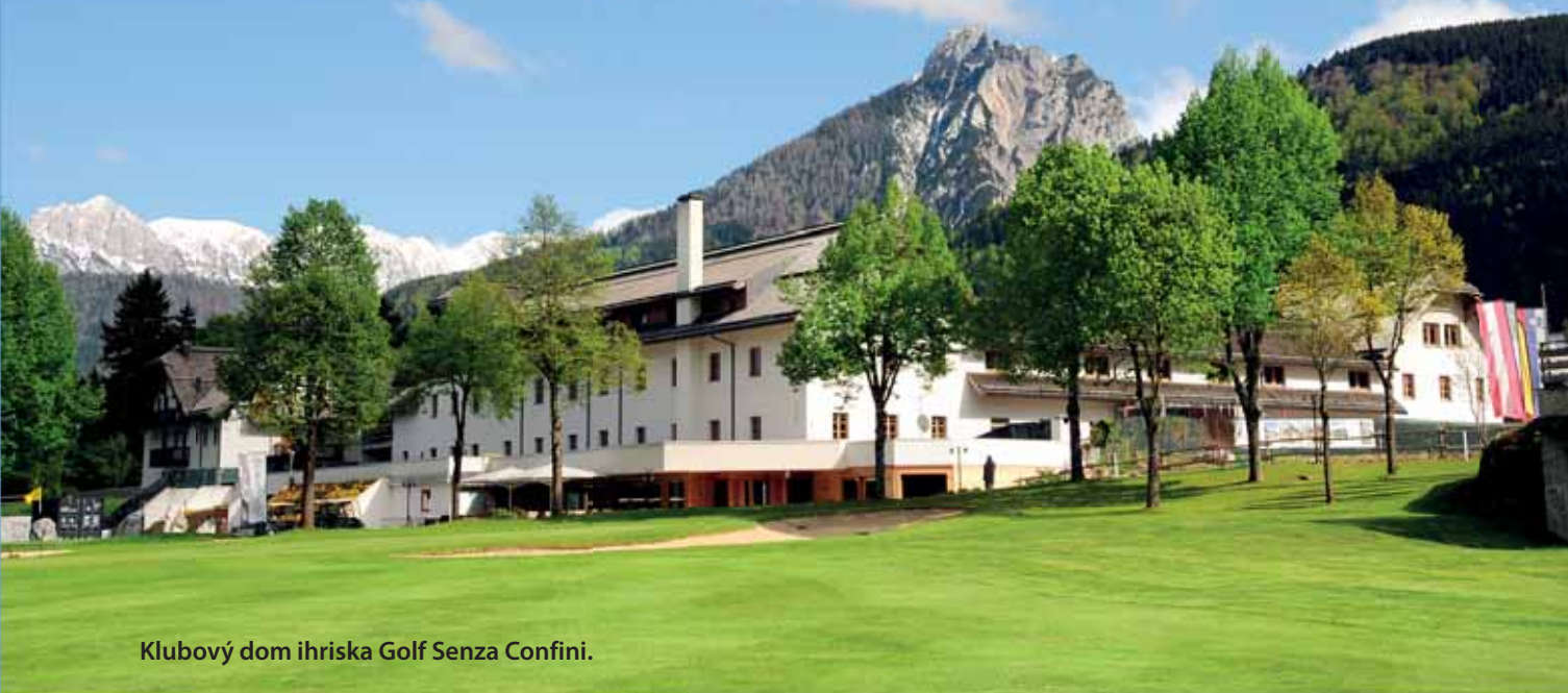
Klubový dom ihriska Golf Senza Confini.