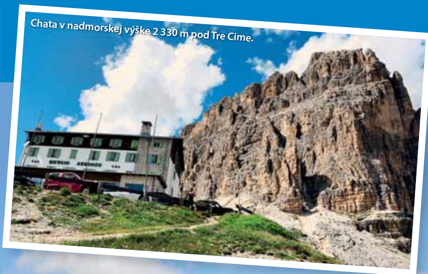
Chata v nadmorskej výške 2 330 m pod Tre Cime.

Informácie o ihrisku: par 70, dĺžka zo žltých odpalísk 5 263 m, poplatok za hru 60 € ( www.golfsenzaconfini.com ).