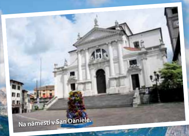
Na námestí v San Daniele.

V Cortine sme otestovali 9-jamkové golfové ihrisko Cortina Golf. Dokonale ukryté ihrisko, otvorené v roku 2010, je obkolesené hustým lesom a vysokými štípmi. Striedanie prudkých výškových rozdielov musíme charakterizovať ako náročné. Je ťažké sústrediť sa na hru, ak si chcete lepšie poobzerať okolie. Ihrisko navrhla kancelária Harradine.