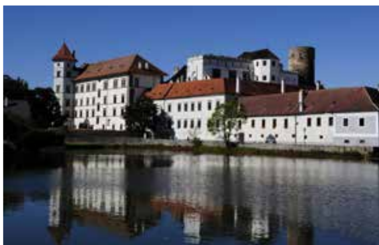
Rozľahlý zámok v Jindřichovom Hradci

Náš malý okruh Južnými Čechami začíname na hrade Landštejn v obci Staré Město pod Landštejnem na pomedzí Moravy, Čiech a Rakúska. Vystúpime strmým schodiskom na veľkú vyhlídkovú vežu a hneď nám ponúknú šampanské. Práve sa koná svadobný obrad a tak turisti mlčky obdivujú výhľad a nerušia svadobčanov. Hrad pravdepodobne založil český kráľ, možno Přemysl Otakar I a počas 13. storočia ho získali Vítkovci. V Roku 1771 hrad vyhorel a už nebol obnovený. Vstupné 70 Kč.