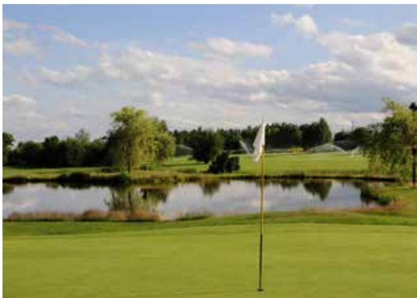
Na golfovom ihrisku Haugschlag

Počas celého pobytu v Južných Čechách sme bývali v Novej Bystřici v penzióne na Bojišti, do ktorého chodievame radi už dlho. Južné Čechy majú čo ponúknuť každému návštevníkovi, či sa zaujíma o históriu alebo o športové aktivi- ty. Odporúčanie na záver – ak plánujete Južné Čechy navštíviť počas letných prázdninových mesiacov, ubytovanie si objednajte dostatočne včas.