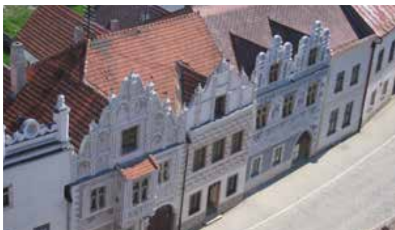
Slavonice, historické domy na námestí

nujúci nad vltavským údolím. Rozhodne patrí k tým najnavštevovanejším a tak musíme riešiť ako stráviť čas niekoľko hodín do prehliadky – prehliadkou anglického parku, ktorý sa rozprestiera až na 58 hektároch. Kráľovský hrad sa prvýkrát spomína v roku 1285. Ranogotický hrad svoj vzhľad zmenil niekoľkokrát rôznymi prestavbami až do súčasnej podoby neogotického zámku. Nedávno otvorili ďalšiu trasu, ktorá zahŕňa návštevu desiatich historických miestností. Vstupné 150 Kč.