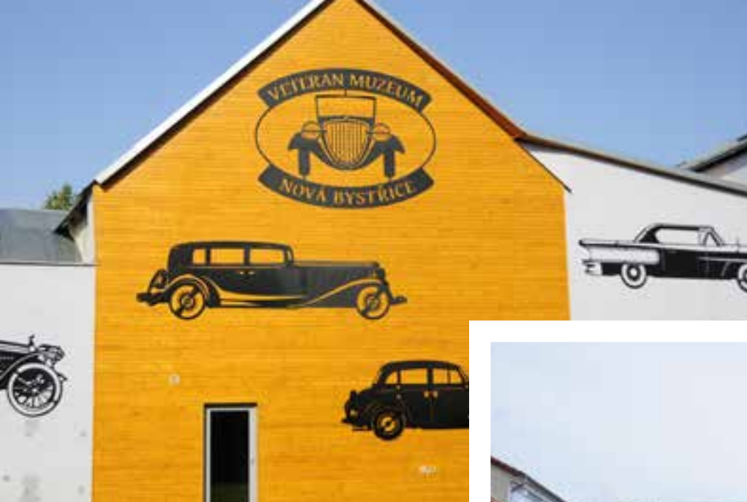
Múzeum veteránov v Novej Bystřici