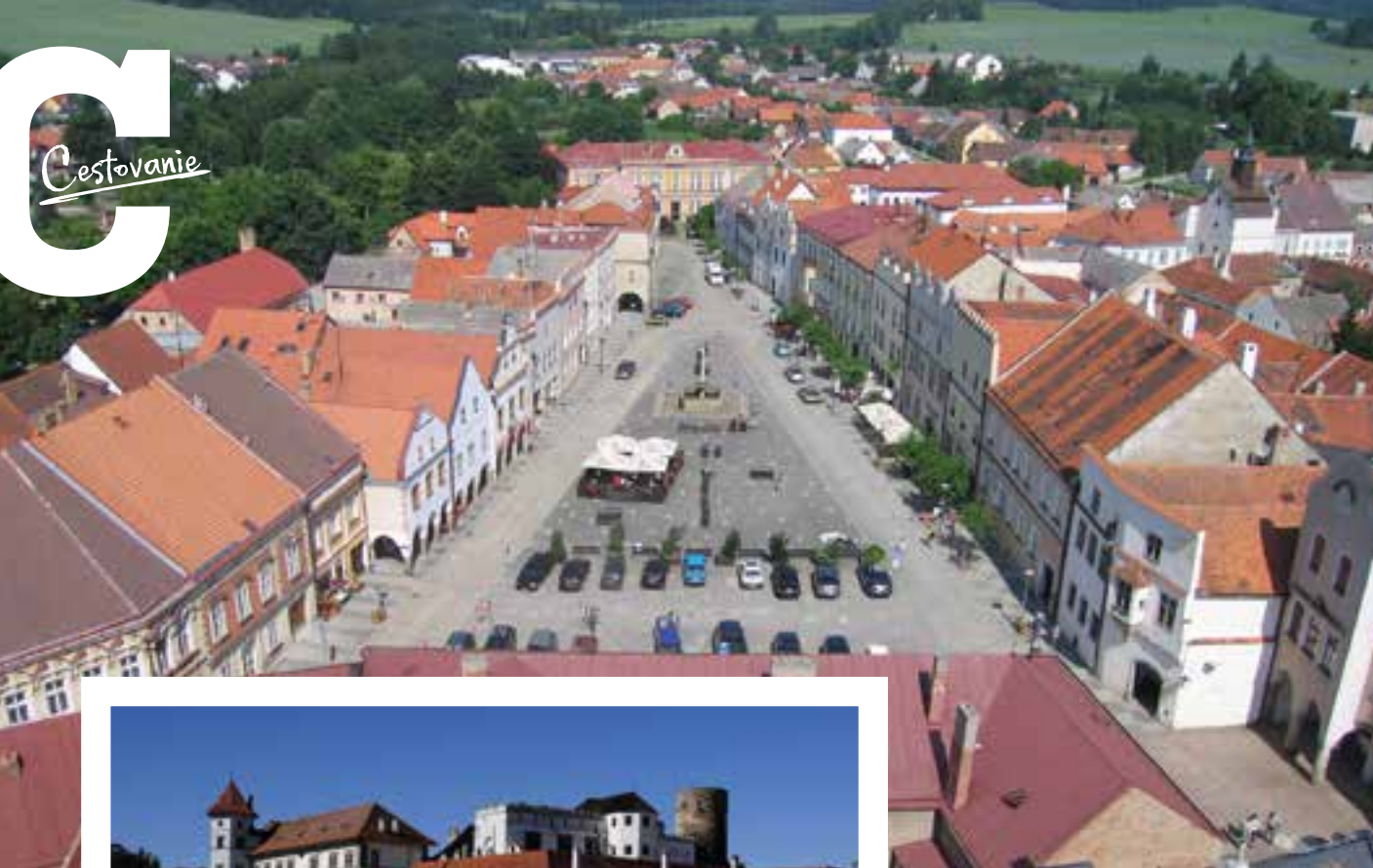
Slavonice, pohľad z kostolnej veže