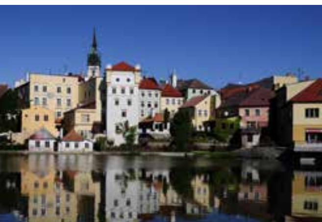
Panoráma mesta Jindřichův Hradec