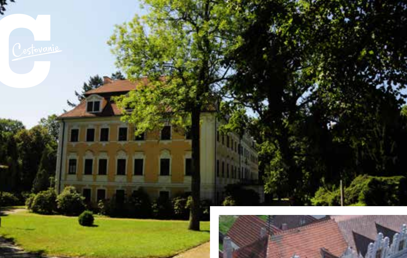
Zámok v Chlume u Třebone