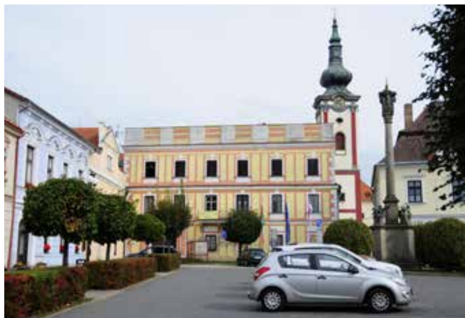
Zámok Nová Bystřice

V Maříži sa zastavíme v známej keramickej dielni a vyberáme si z bohatej ponuky hrnčiek a ďalších keramických produktov. Deti si tu môžu namaľovať svoj vlastný hrnček.