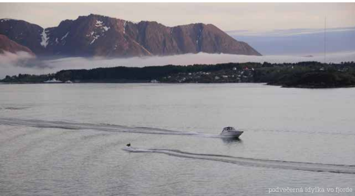
podvečerná idylka vo fjorde