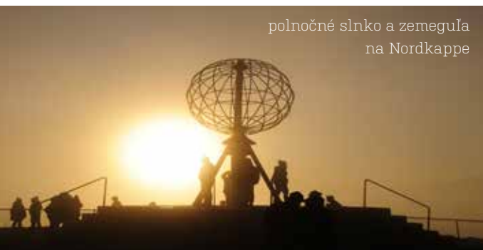
polnočné slnko a zemeguľa na Nordkappe