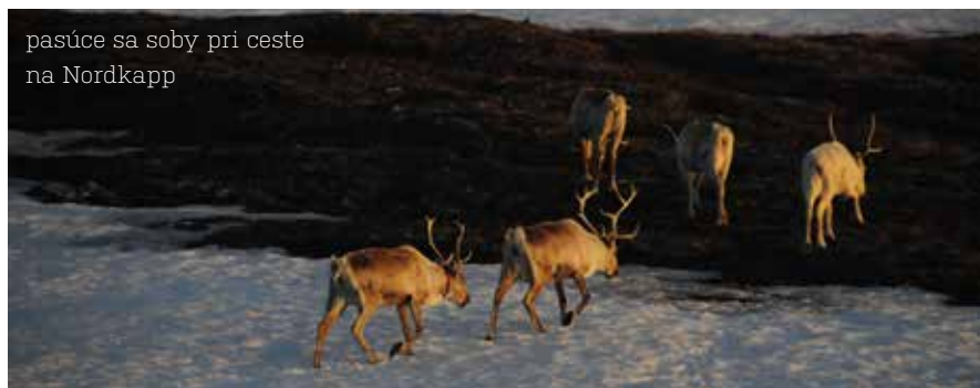
pasúce sa soby pri ceste na Nordkapp