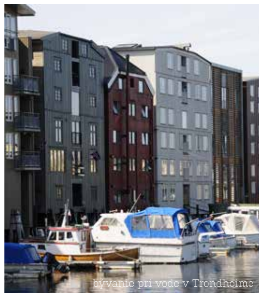
bývanie pri vode v Trondheime