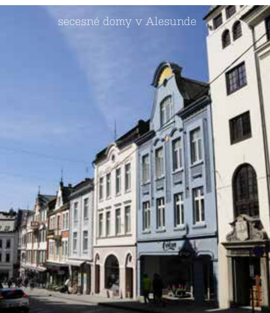
secesné domy v Alesunde