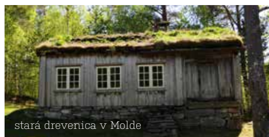
stará drevenica v Molde

rybársku dedinku Bud a pozrieť si aj opevnenia z druhej svetovej vojny a potom pokračovať ďalej cez Hustadviku až po pôsobivú pobrežnú „Atlantickú cestu“, ktorá je označovaná aj ako nórska stavba storočia.