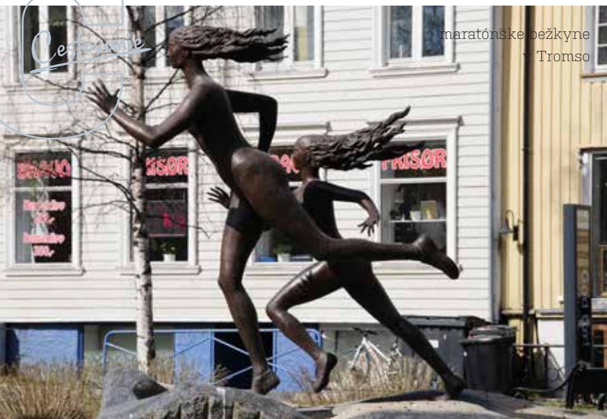
maratónske bežkyne v Tromso