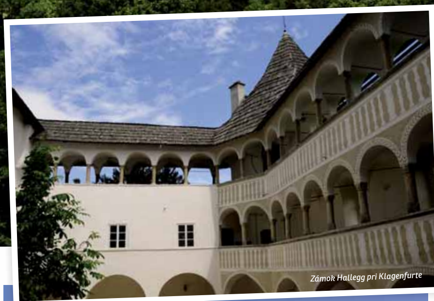
Zámok Hallegg pri Klagenfurte

ristika, plážový volejbal. Z deviatich golfových ihrísk v Korutánsku sú dve ihriská v zozname najlepších rakúskych ihrísk – Klagenfurt Seltenheim a Velden – Köstenberg. Vysokohorské ihrisko Bad Kleinkirchheim je jedinečné prepravou golfistov medzi jamkami golfovým minibusom z dôvodu veľkého výškového rozdielu. V zime je to hlavne zjazdové a bežecké lyžovanie, ale aj korčuľovanie na zamrznutých jazerách.