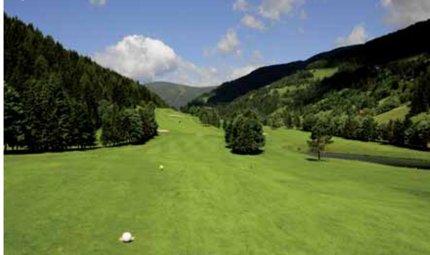
Golfové ihrisko Bad Kleinkirchheim