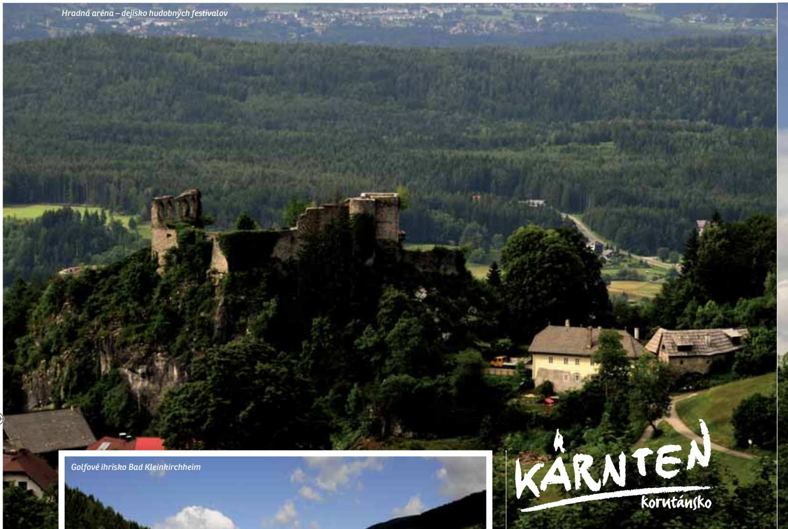
Hradná aréna – dejisko hudobných festivalov