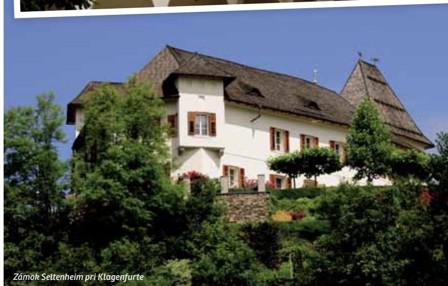
Zámok Seltenheim pri Klagenfurte

Kulinárske korutánske špeciality možno ochutnať v jednoduchých reštauráciách, ale aj v reštauráciách ocenených napríklad podľa Michelina. A čo treba ochutnať? Korutánske Kasnudeln (podobajú sa na pirohy, sú plnené tvarohom, zemiakmi a bylinkami) a korutánsku polievku Ritzcherl (výdatná polievka s krúpami, údeným mäsom a zeleninou). S dovolenkou v Korutánsku v lete či v zime budete určite spokojní a radi sa sem vrátite aj pre relatívne krátky čas cesty, ktorá trvá do štyroch hodín z Bratislavy k jazeru Wörthersee. #