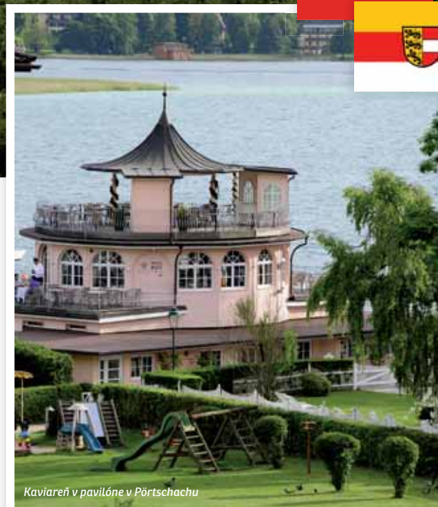
Kaviareň v pavilóne v Pörtschachu