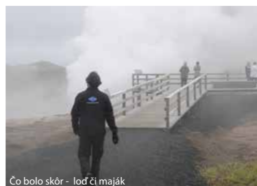
Čo bolo skôr - loď či maják