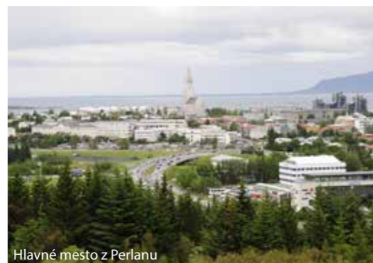
Hlavné mesto z Perlanu