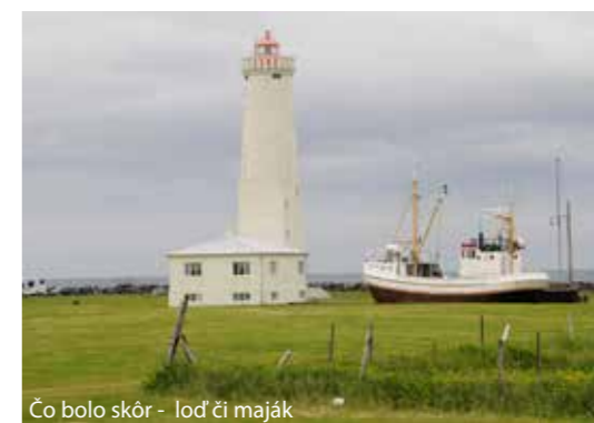
Čo bolo skôr - loď či maják

Nádherný výhľad na mesto z vtáčej perspektívy ponúka 73 m veža luteránskeho kostola Hallgrímskirkja , najväčšieho kostola na Islande, ktorý patrí aj k najvyšším stavbám na ostrove.