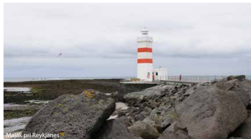
Maják pri Reykjanes