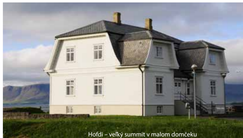
Hofdi – veľký summit v malom domčeku