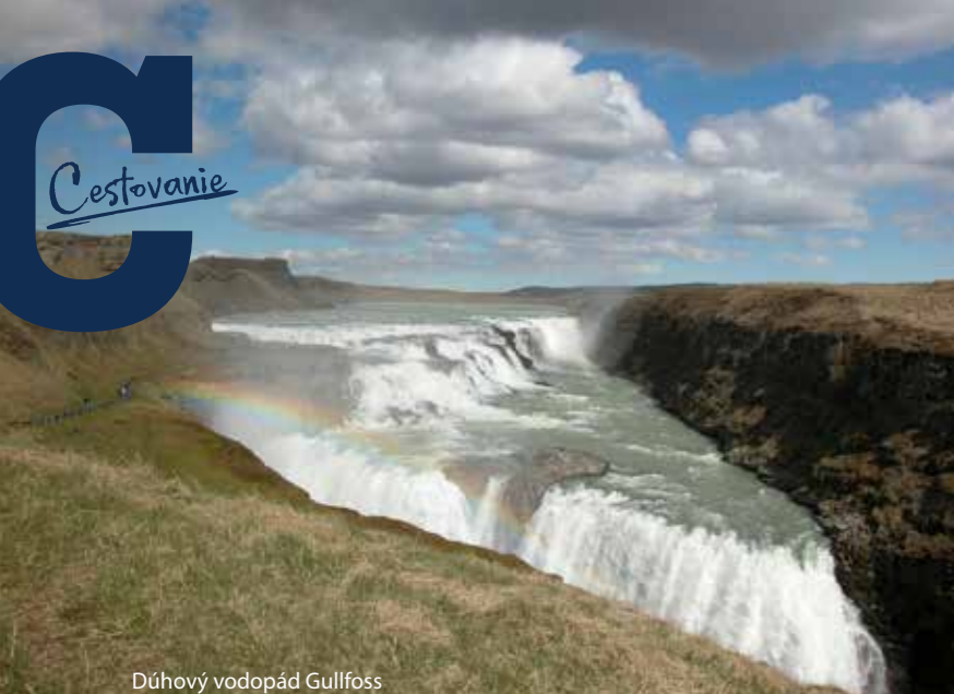
Dúhový vodopád Gullfoss