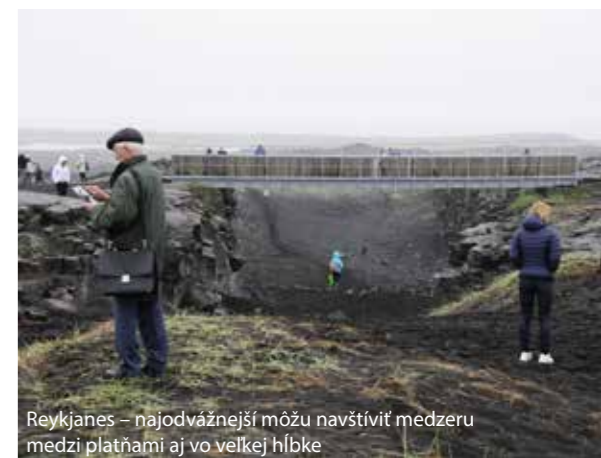
Reykjanes – najodvážnejší môžu navštíviť medzeru medzi platňami aj vo veľkej hĺbke