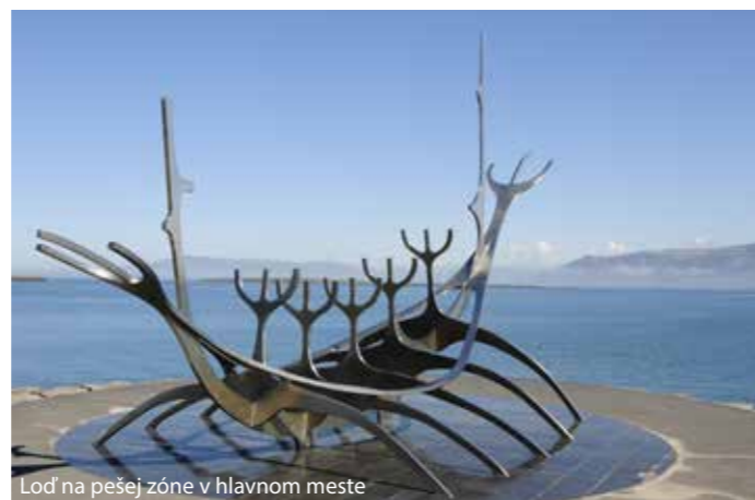
Loď na pešej zóne v hlavnom meste