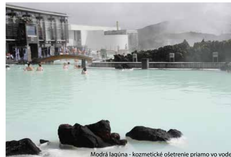
Modrá lagúna - kozmetické ošetrovanie priamo vo vode