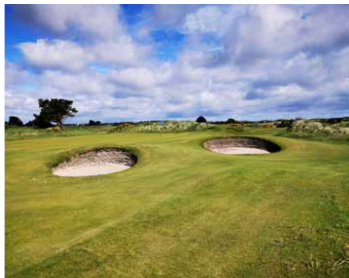
Len nezahrať do typického hrncového bunkra na ihrisku Portmanrock