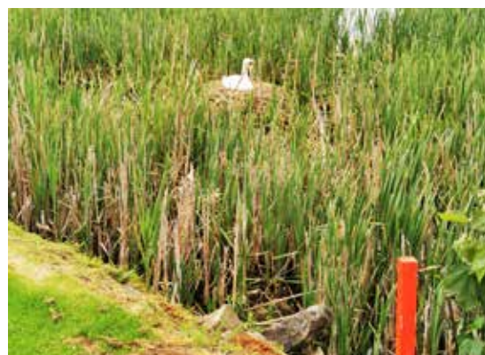
Hniezdiaca labuť strážiaca jamkovisko ťažkej trojparovej jamky na ihrisku Balcarrick, loptičku som utopila tesne pri jej hniezde

Ďalší deň smerujeme na juh od Dublinu do golfového klubu Wicklow, ktorý založili v roku 1904 na útesoch s jedinečnými výhľadmi na more a pohorie Wicklow. Z prvej jamky vidíme aj ruiny hradu Black Castle z roku 1176 v prístave vo Wicklow. Aj na tomto ihrisku sa nám podarilo zahrať len prvých osem jamiek. Vytrvalý prudký dážď ihrisko zavláždil až do neskorého večera.