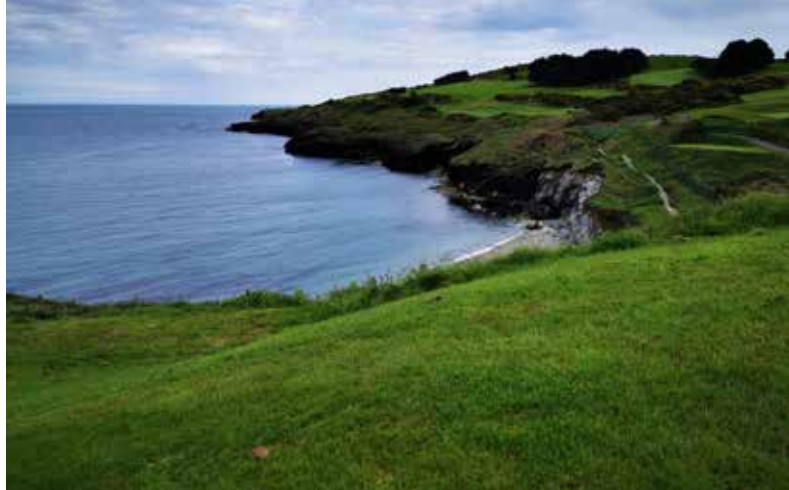
Veľmi ťažký par 3 ihriska Wicklow, v pozadí druhá deviatka, pri tejto jamke malá súkromná pláž

A opäť cestujeme na sever, na ihrisko Laytown and Bettystown. Hrali sme ho počas poslednej návštevy v roku 2019, keď prebiehal jeho redi-