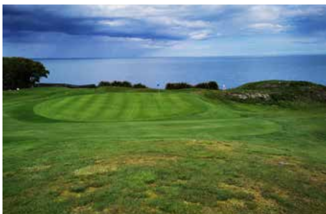
Určite najpôsobiliejšia jamka prvej deviatky ihriska Wicklow

ho rozšírili na deväť jamiek a už o dva roky na 18. Postavila ho sama príroda, bez vážnych zásahov človeka. Obkolesené vodou je vystavené často aj veľmi silnému vetru. Preverí najmä patovanie na veľmi rýchlych jamkoviskách. V roku 1971 pribudla ďalšia deviatka. Hral sa tu turnaj Irish Open už 19x!