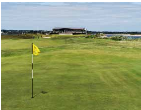
Na jamke ihriska Sutton pre klubovým domom

Na sever od Dublinu možno navštíviť Newgrange, neolitický monument v údolí Boyne. Postavili ho približne pred 5 200 rokmi, je starší ako Stonehenge a pyramídy v Gize. Priechod dlhý 19 m vedie do komory s 3 výklenkami. Priechod a komora sú v jednej rovine s vychádzajúcim slnkom počas zimného slnovratu. Odporúčam vopred rezervovať termín na tento mimoriadny zážitok.