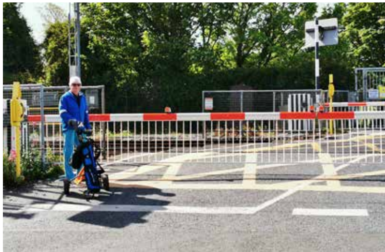
Na ihrisku Sutton musia golfisti dvakrát čakať na rušnom priechode cez železničnú trať, niektorí členovia poznajú cestovný poriadok naspamäť a tak často bežia cez trať, aby nemuseli dlho čakať