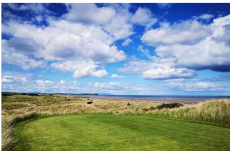
Jamka ihriska Seapoint v dunách ukrytá