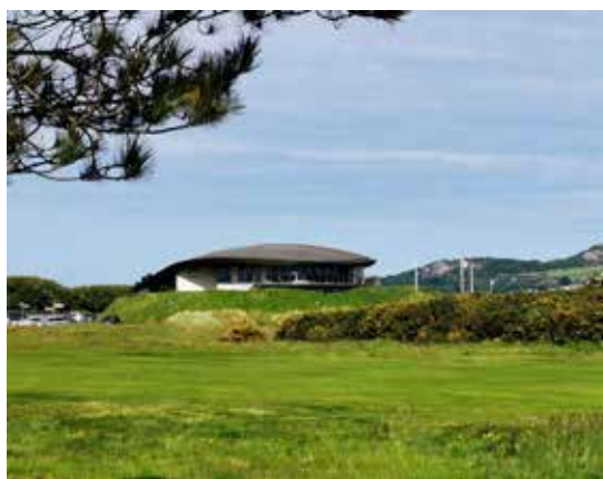
Klubový dom ihriska St. Annes pripomína lastúru

Niekoľko praktických poznámok na záver. Ak si požičiate auto a použijete okružnú cestu okolo Dublinu A50, mýto už nemusíte uhradiť, automaticky ho zúčtuje požičovňa. Ak sa počas jazdy potrebujete občerstviť alebo načerpať