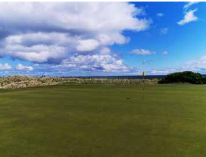
Typická linksová jamka na ihrisku Laytown and Bettystown s dunami a veľkolepými výhľadmi na šíre more