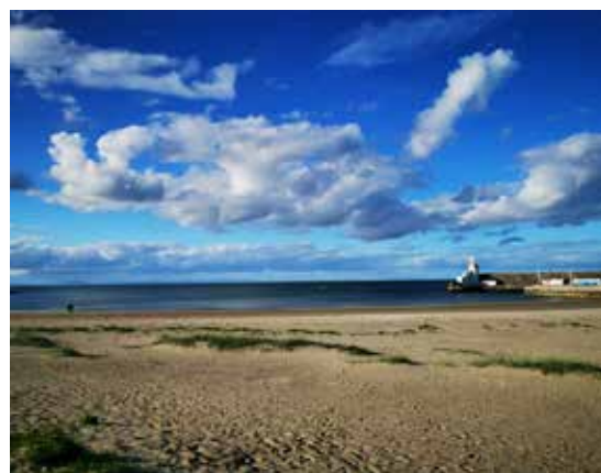
Na pláži v Balbriggane

zadných odpalísk 2591 m, z červených 2365 m, par 35, štandardný poplatok za hru za 9 jamiek 45 €, 18 jamiek 80 €. www.suttongolfclub.org