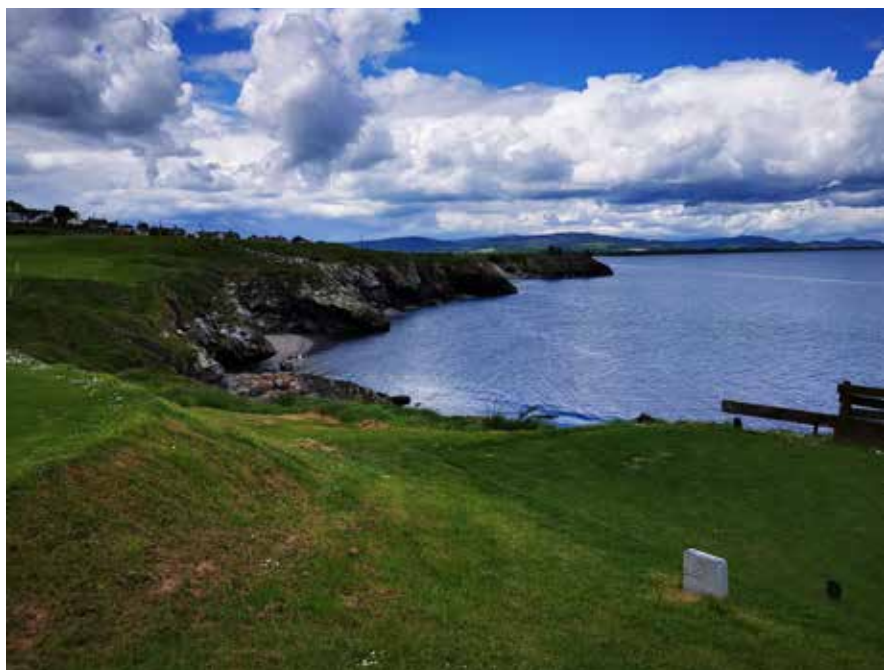
Golfové ihrisko Wicklow na útesoch, v pozadí Black Castle

zajn a našim zámerom bolo porovnať. Bohužiaľ, zámerom bolo kráčať s dobou a ihrisko predĺžiť. Napr. jamka par 3 meria teraz viac ako 170 m. Na ihrisku sú len 3 jamky par 3. Predĺženie sa však dosiahlo za cenu križovania niektorých jamiek a viacerých varovaní o tom, kto má na ktorej jamke prednosť. Intenzívne sa diskutuje o tom, či ihrisko bolo lepšie predtým alebo potom. Par ihriska 71, dĺžka z majstrovských odpalísk 5783 m, z červených 5042 m. Poplatok za hru počas týždňa do 12.00 - 95.00 €, 12.10 - 2.30 - 69,50 €, 2.40 - 4.30 - 52.50 €, po 4.40 - 45.00 €. www.landb.ie