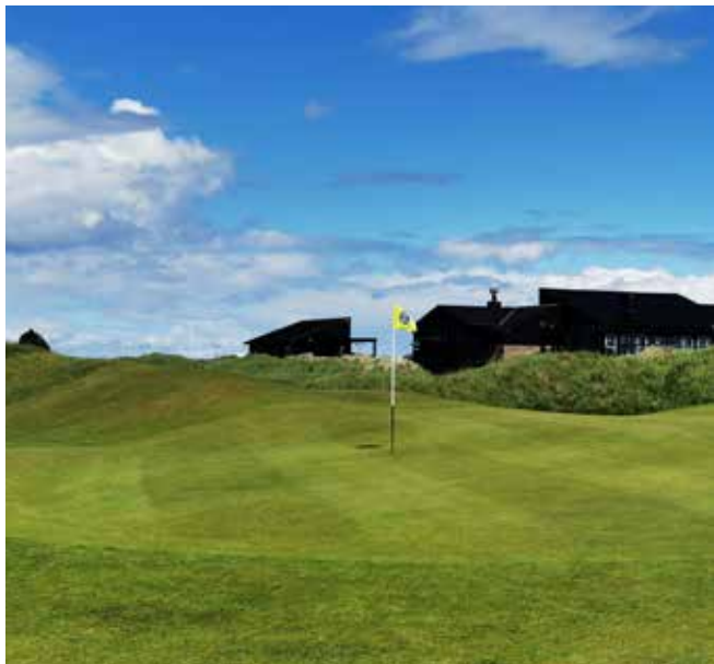
Na jamkovisku 18. jamky pred klubovým domom ihriska Seapoint