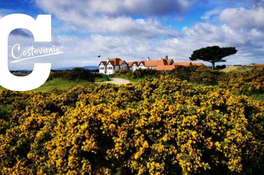
Klubový dom ihriska Portmarnock v zajatí invazívneho pichlavého hlodáša, z ktorého loptičku len ťažko vyberiete