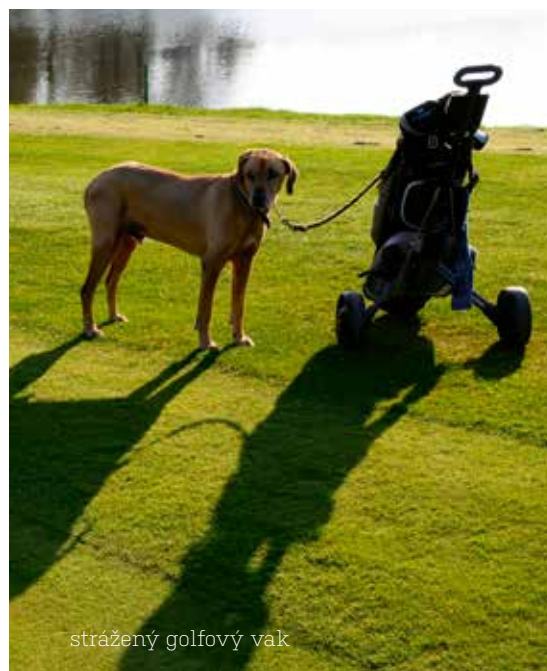
strážení golfový vak