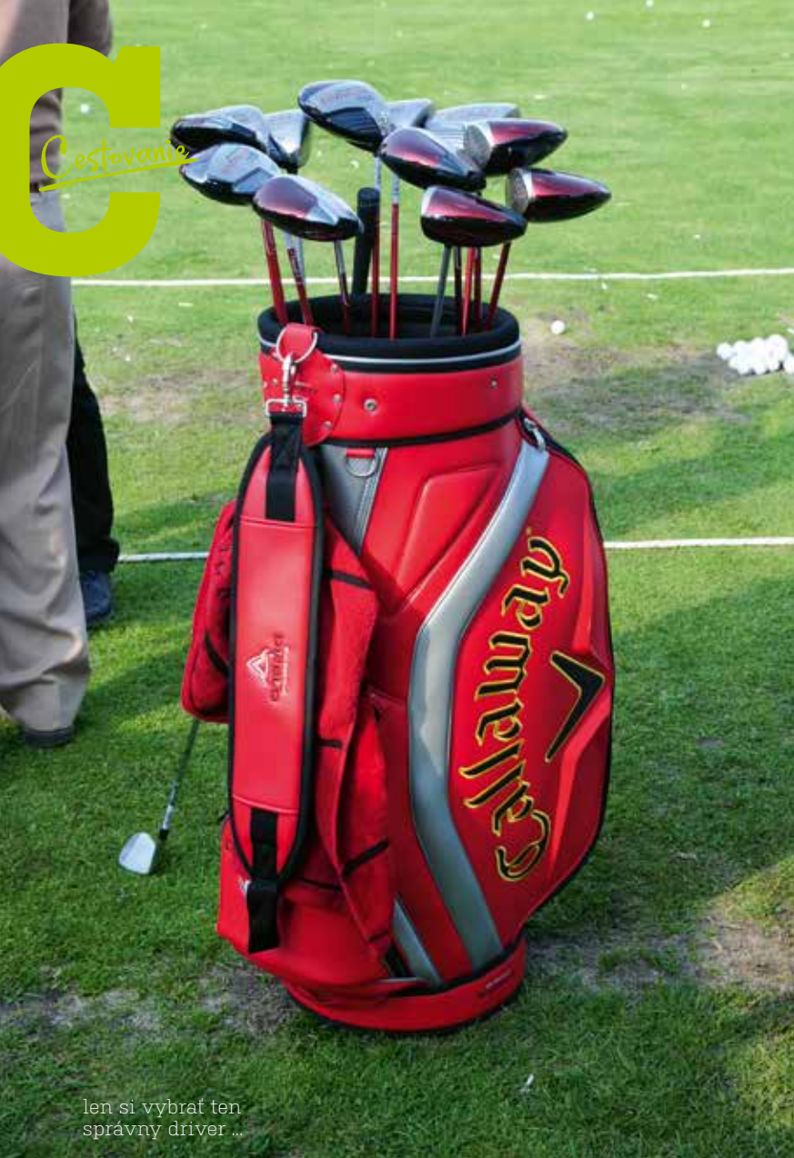
len si vybrať ten správny driver ...