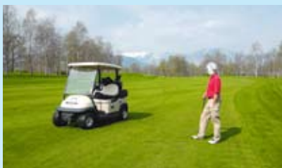
Royal Park Torino s vrcholmi Álp v pozadí