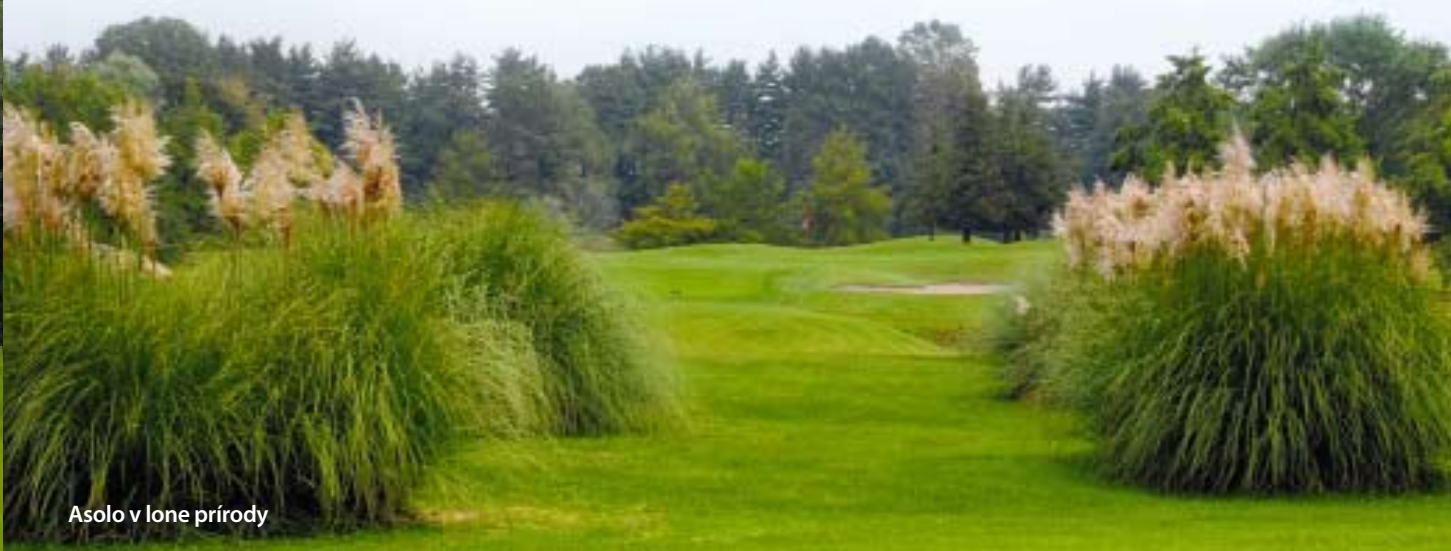
Asolo v lone prírody

Na ihrisku Palazzo Arzaga Golf 18 jamiek navrhol Jack Nicklaus a ďalších 9 jamiek Gary Player s typickým zatrávením stien bankrov. Nevšedné ubytovanie poskytuje hotel Palazzo Arzaga v talianskej provincii Brescia v tesnej blízkosti najväčšieho talianskeho jazera Garda v prírodnej rezervácii. Nádherné panské vidiecke sídlo z 15. storočia šetrne prebudovali na 5-hviezdičkový hotel. Zachovali štýl minulých storočí – kamenné podlahy, biele steny, fresky na schodištiach, kozuby, drevené stropy, tradičný dobový nábytok z lombardského a benátskeho obdobia a bohaté textilie. Dve ▷