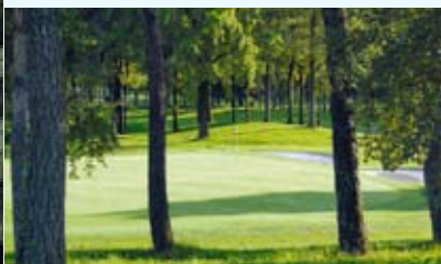
Bergamo ponorené medzi horami a vy- sokými stromami