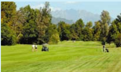
Príjemné golfové ihrisko Lecco