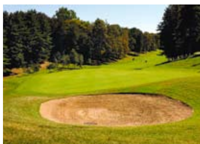
Pinetina: osemnásť jamka strmo do kopca

jedinečné izby majú na stenách pôvodné nástenné fresky zo 16. storočia. Palazzo Arzaga je tipom na dobrú dovolenku po celý rok, pretože teplota tu neklesne pod päť stupňov Celzia, a súčasne veľmi dobrou základňou na výlety do bližšieho či vzdialenejšieho okolia.