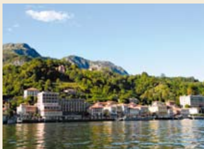
Na vlnách jazera Como

► Neďaleko Benátok sa vyrába slávne Prosecco. Navštívili sme Relais Duca di Dolle