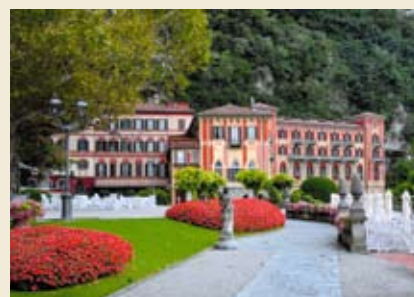
Luxusný Grand hotel Villa d'Este

► Milovníkov skla poteší návšteva ostrova Murano neďaleko Benátok. História výroby skla si možno pozrieť v miestnom múzeu a potom sa túlať do vyčerpania po malých sklárskych dielničkách a obchodíoch a nakoniec si domov odniesť to, čo sklár zo