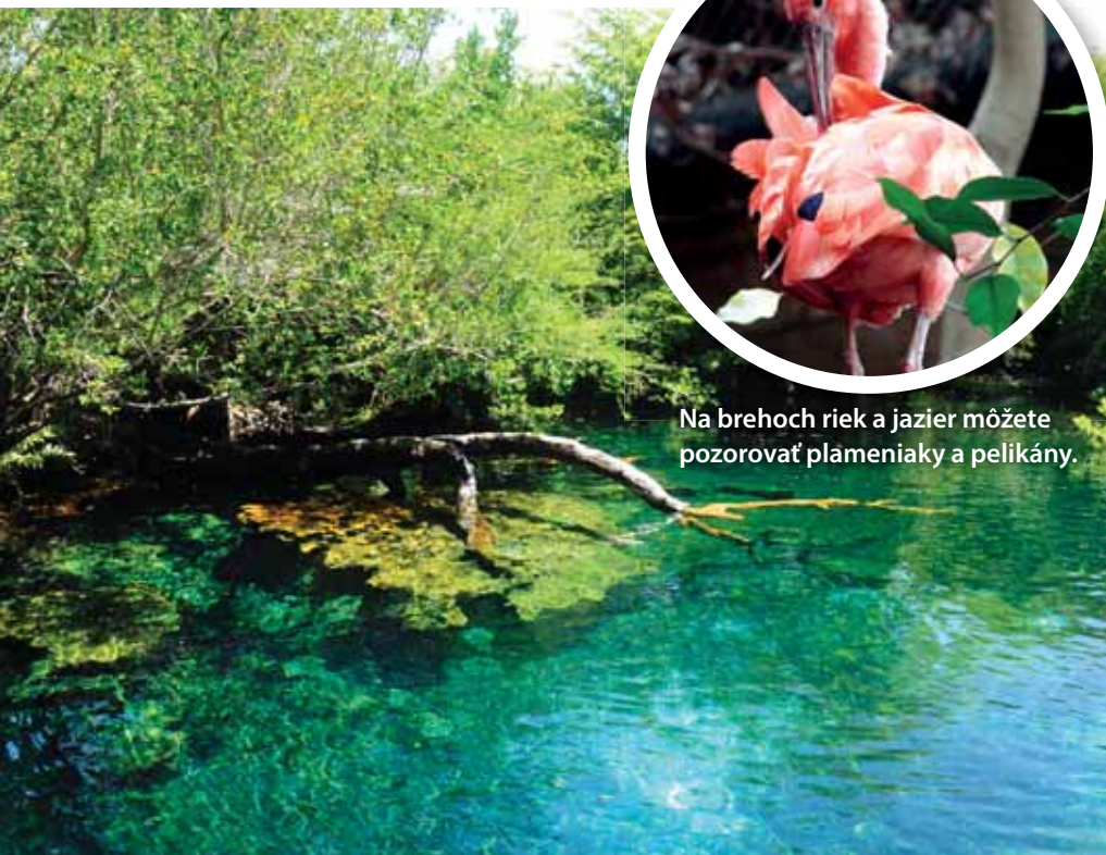
Na brehoch riek a jazier môžete pozorovať plameniaky a pelikány.