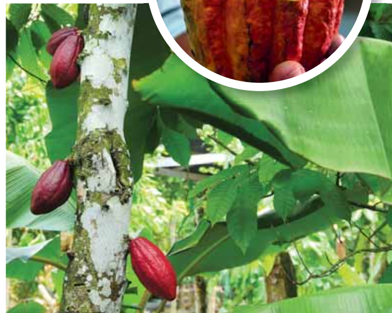
▼ Plody kakaovníka.

Na pobreží s dĺžkou 1 288 km nájdete aj pláž Macao s palmami a belostným pieskom.