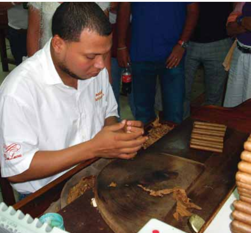
◀ Výroba cigár.