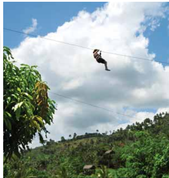
◀ Chránená krajinná oblasť v Punta Cana.