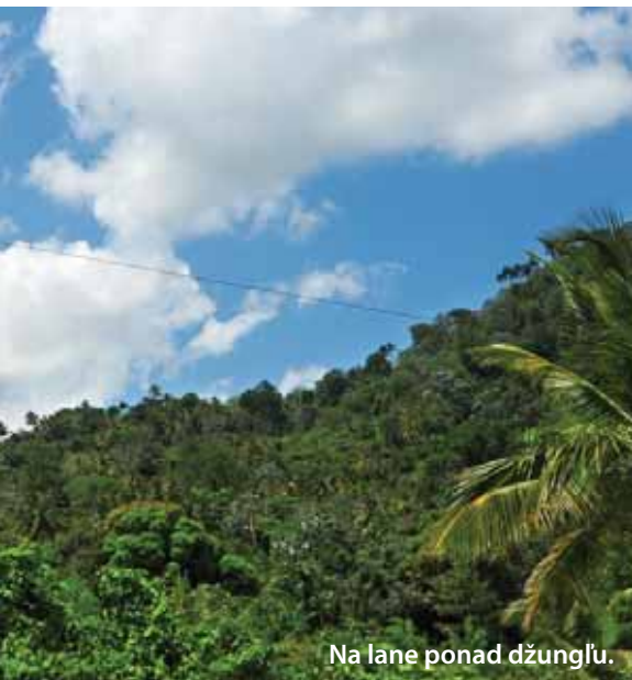
Na lane ponad džungľu.