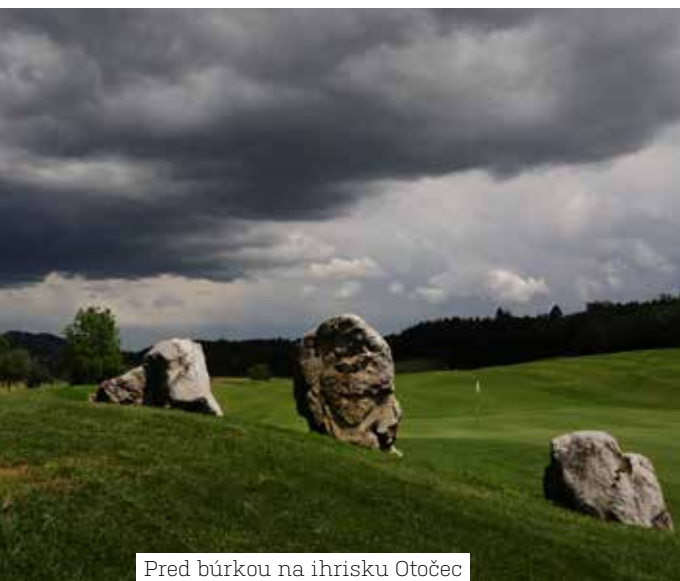
Pred búrkou na ihrisku Otočec

Slovinsko má 2 067 000 obyvateľov a 46,6 km morského pobrežia. Najvyšší je Triglav, ktorý dosahuje výšku 2 864 m. 1. mája 2004 sa stalo členskou krajinou EÚ, platí sa tu eurom. V Slovinsku v súčasnosti končí schengenský priestor a preto sa treba pripraviť na kontroly na hranici s Chorvátskom. Zo Slovinska pochádza aj najlepšia šéfkuchárka na svete za rok 2017 Ana Roš.