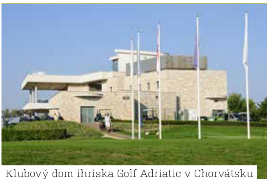
Klubový dom ihriska Golf Adriatic v Chorvátsku