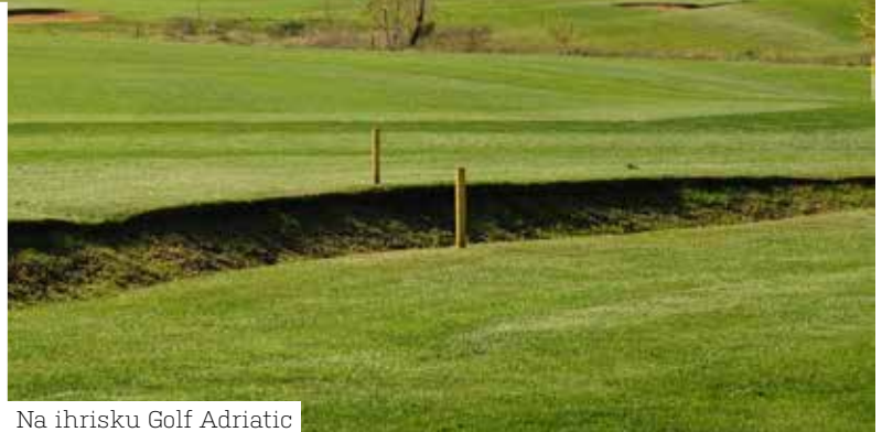
Na ihrisku Golf Adriatic

Už tradične sa pred alebo po veľtrhu koná niekoľkodňová cesta pre novinárov píšucich o golfe a tour- operátorov. Opäť po prvý krát sa tieto cesty konali rovnako ako golfový turnaj v troch krajinách – Slovinsku, Rakúsku a Chorvátsku.