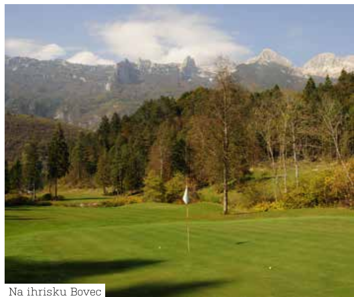
Na ihrisku Bovec

lanová dráha, plávanie, muškárenie ako aj turistika a cyklistika. Lanová dráha v kaňone Učja je najdlhšia v Európe – 4,5 km. Po desiatich oceľových kábloch dlhých 250 až 600 metrov, klesnete o 200 metrov nad riekou Učja očarení jedinečnými výhľadmi na údolie rieky Bovec a vrcholy Julských Álp. Rieka a jej okolie je súčasťou oblasti NATURA 2000.