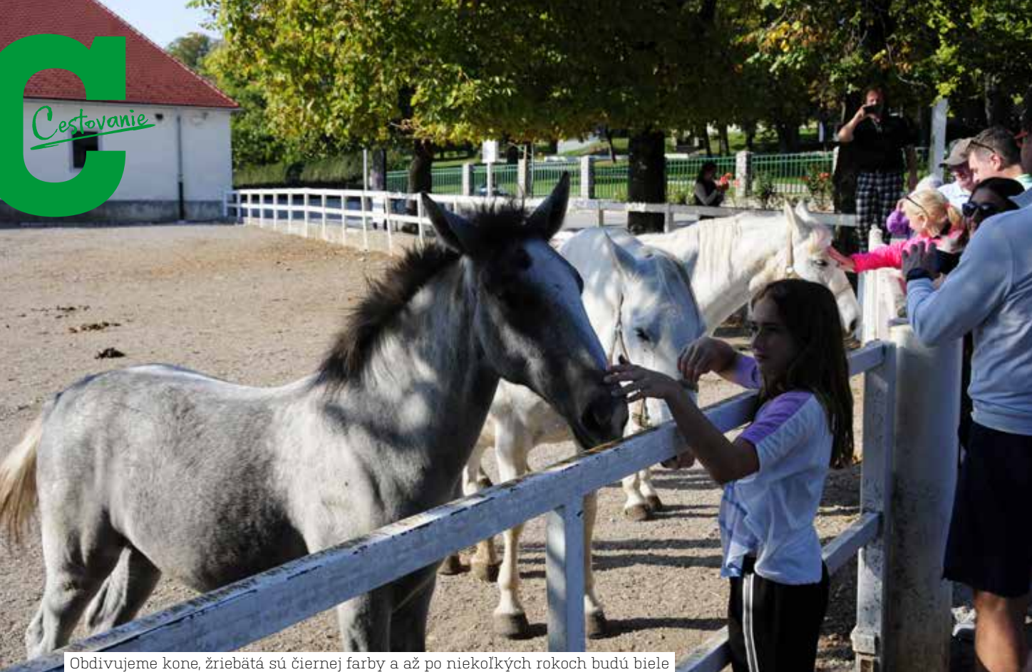
Obdivujeme kone, žriebäta sú čiernej farby a až po niekoľkých rokoch budú biele