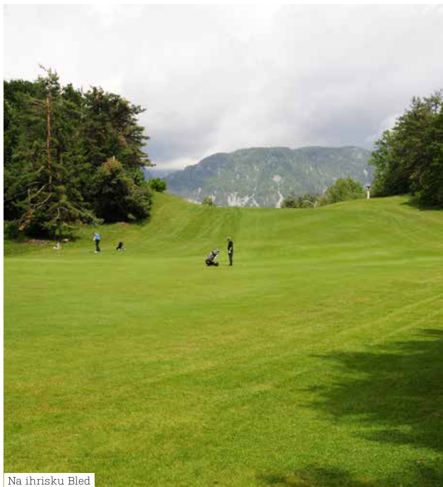
Na ihrisku Bled

Cestovanie za golфом doplnené spoznávaním prírodných krás Slovinska možno odporučiť. Nie je to od nás ďaleko a golfovú dovolenku možno spojiť s golфом aj v susednom Taliansku, Rakúsku ako aj Chorvátsku ( www.alpe-adria-golf.com ). Veľkou výhodou golfu v Slovinsku sú krátke vzdialenosti medzi jednotlivými ihriskami. Nikdy to nebude