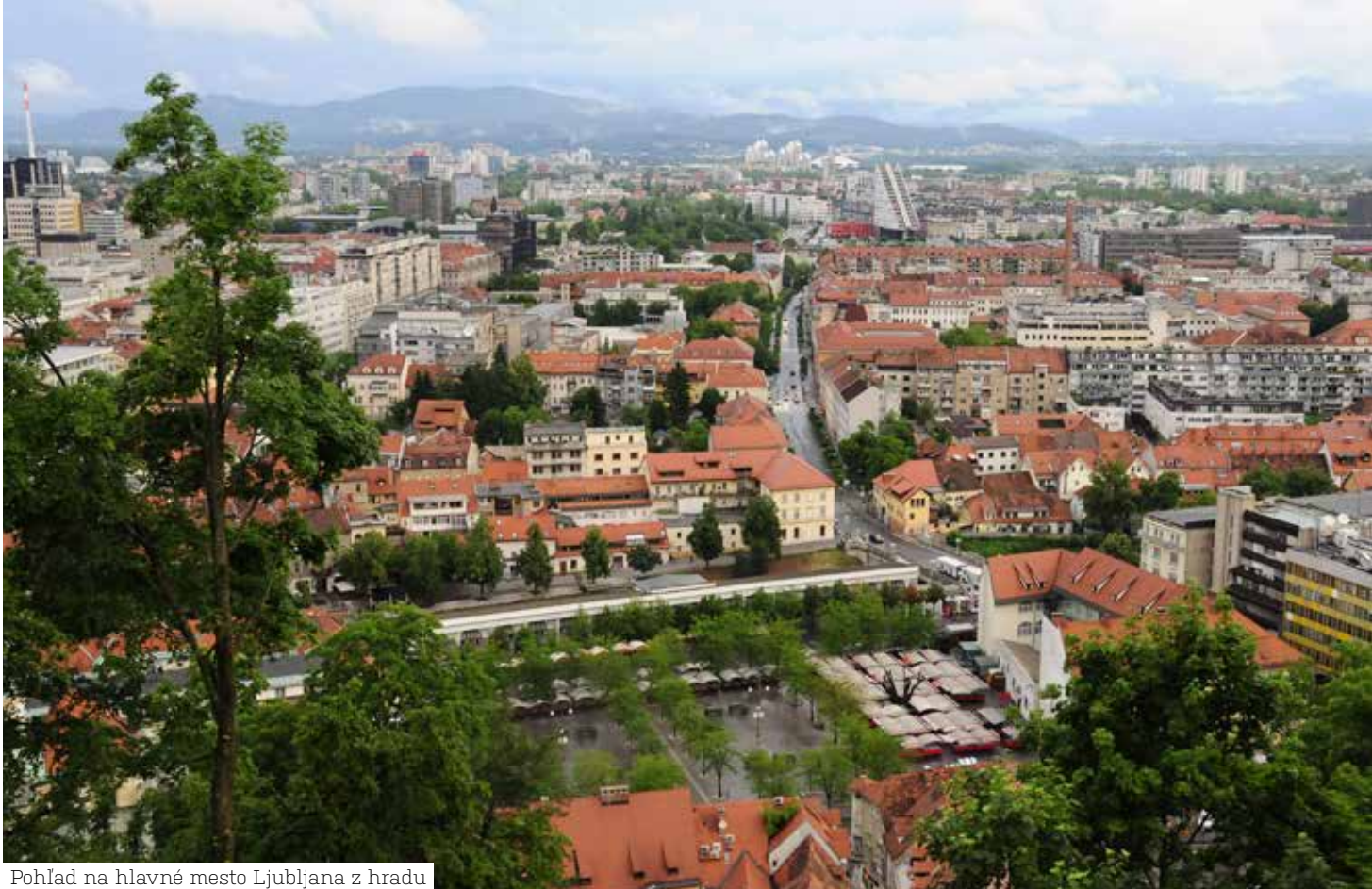
Pohľad na hlavné mesto Ljubljana z hradu