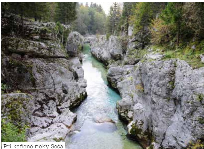
Pri kaňone rieky Soča