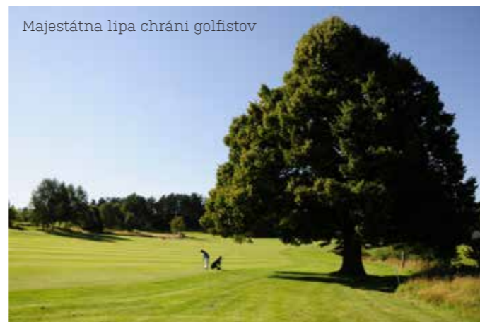
Majestátna lipa chráni golfistov

Nevstupovať do priestorov vyhradených pre členov. Najmä vo Veľkej Británii to majú dámy na niektorých ihriskách komplikované. Ak tam vôbec môžu hrať, možno tam nebudú samostatné dámske odpaliská a dádam odporúča, aby si vybrali odpalisko, ktoré im najlepšie vyhovuje. Ak si dáma náhodou niečo zabudne doma a chce si dokúpiť v obchode priamo na ihrisku, nie vždy sa to podarí, niektoré obchody na ihriskách vôbec neponúkajú tovar pre golfistky. Vo vyššie uvedených dvoch krajinách nie je zvykom rozvážať a ponúkať golfistom občerstvenie, takže zobrať si všetko potrebné so sebou na ihrisko.