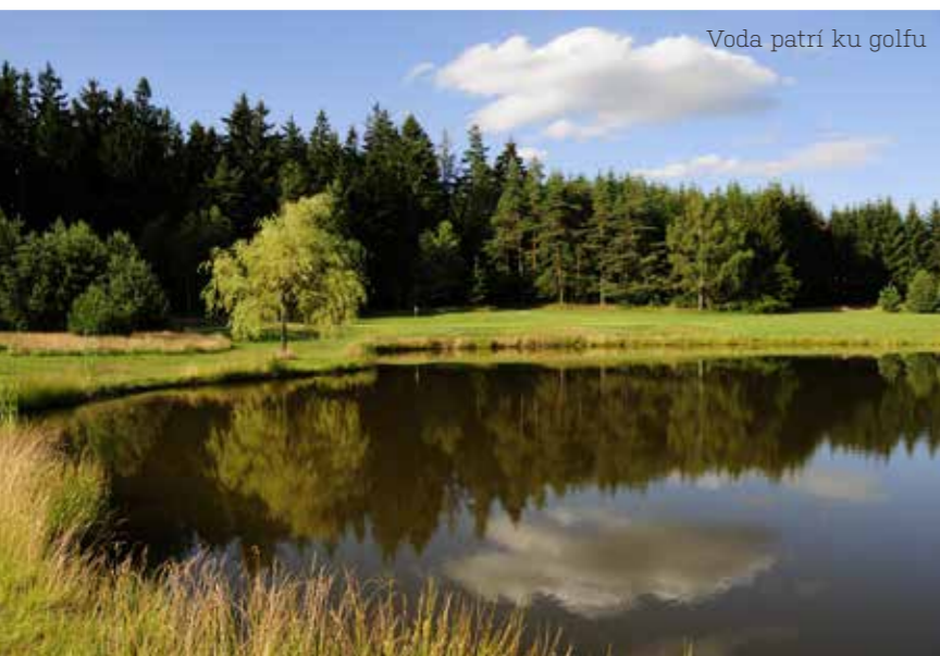
Voda patrí ku golfu