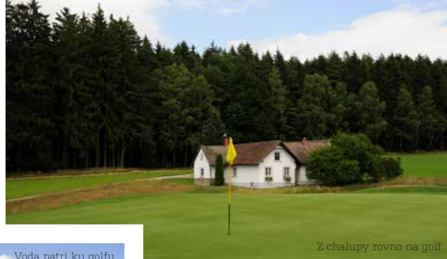
Z chalupy rovno na golf